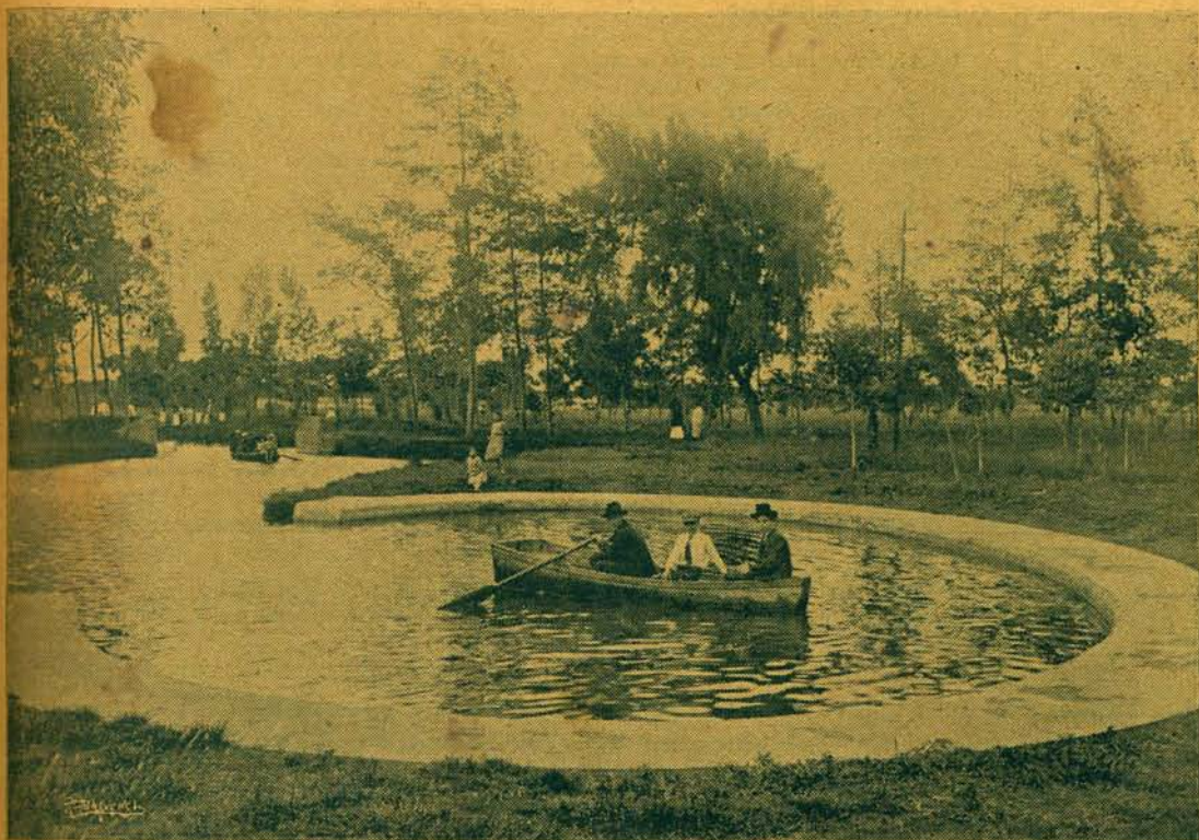
El Bosque de los Niños en La Sabana